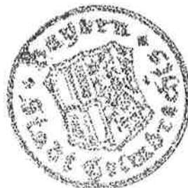
Stefan Pöhlmann 1. Bürgermeister